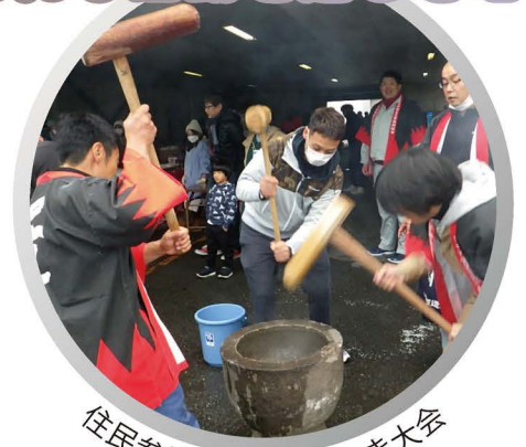
住民参加する年末餅つき大会