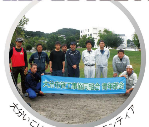
大分いていの道の芝刈りボランティア