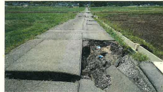
地震により破損した水道管

2016年(平成28年)4月に発生した熊本地震の災害復旧に大分市管工事協同組合からも多くの組合員が派遣され、給水管の復旧や漏水の調査など応急復旧活動を行いました。